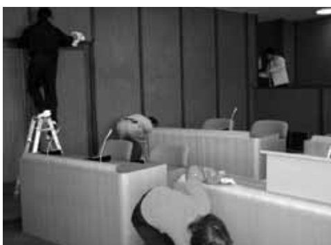
議員全員による年末大掃除の様子