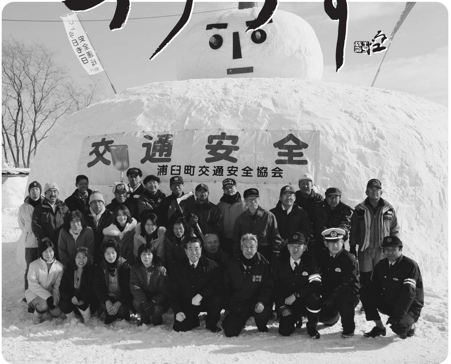
交通安全を願って 巨大雪だるま【2月1日】